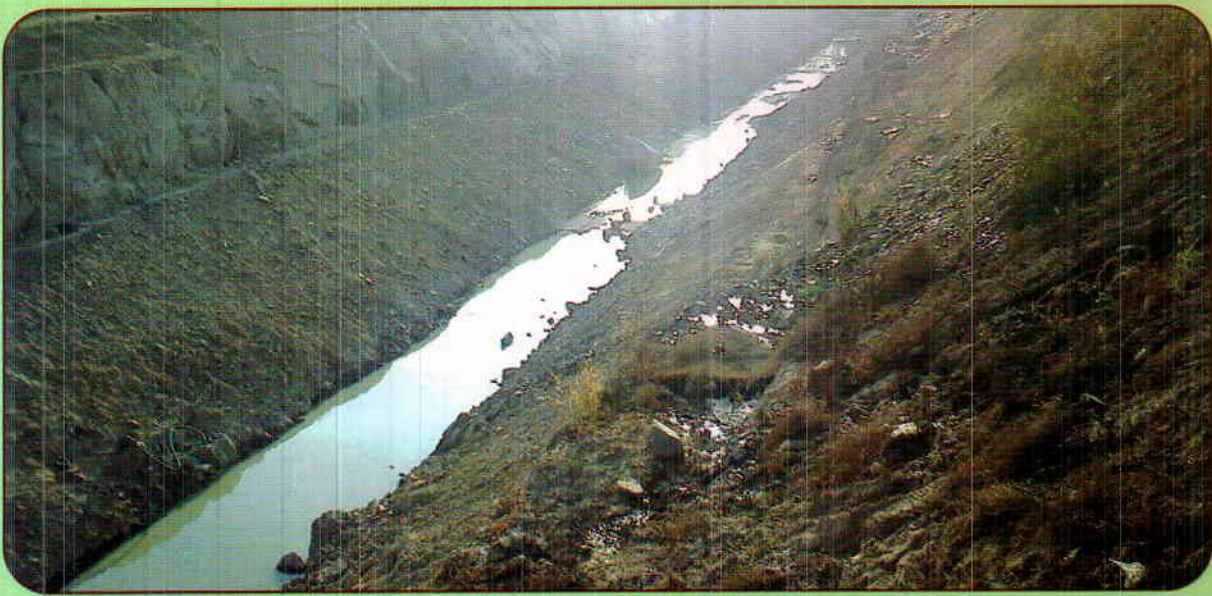
UPPER BHADRA PACKAGE - 1 : INTAKE CANAL EXCAVATION AT CH - 1900M