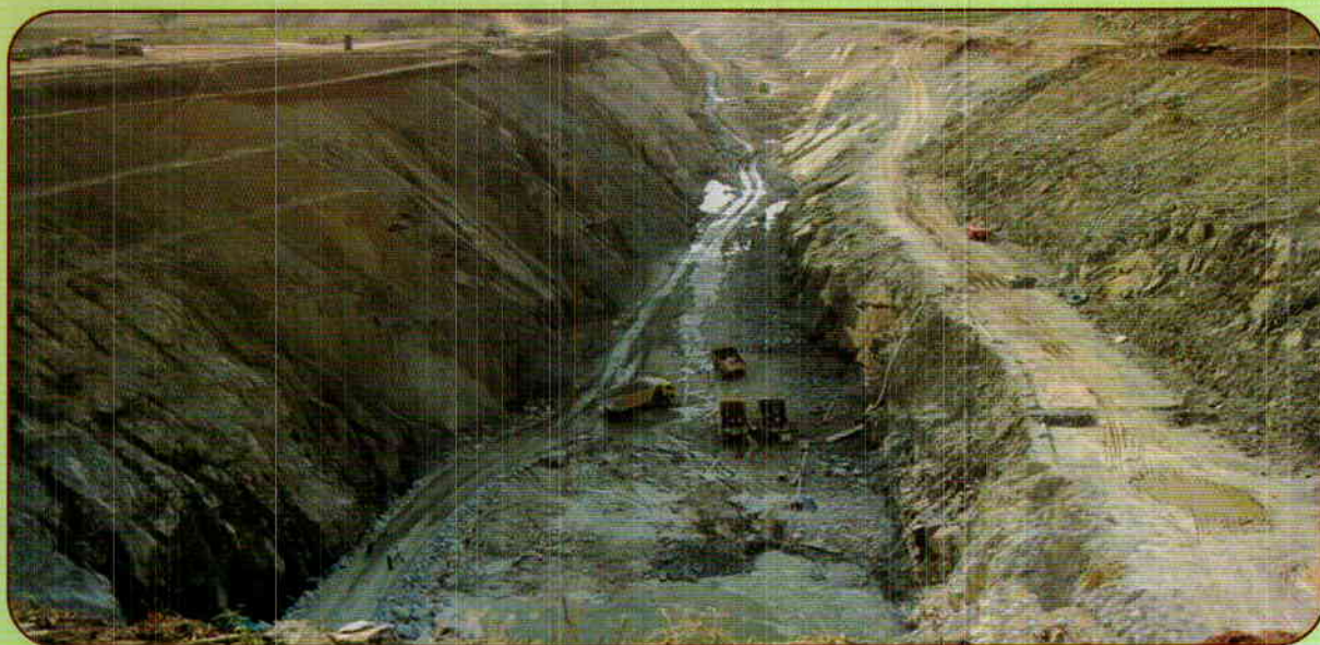
UPPER BHADRA PACKAGE - 2 : PUMP HOUSE - 1 NEAR SHANTIPURA