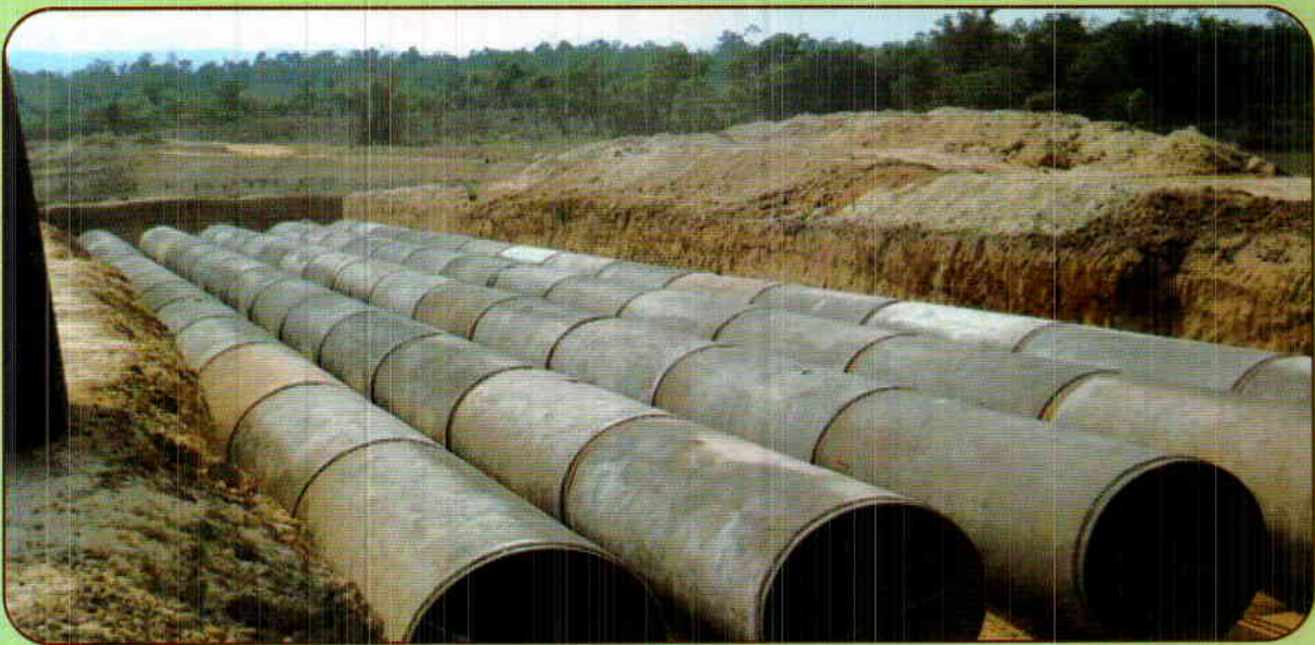
UPPER BHADRA PACKAGE - 1 : RAISING MAIN PUMP HOUSE - 1