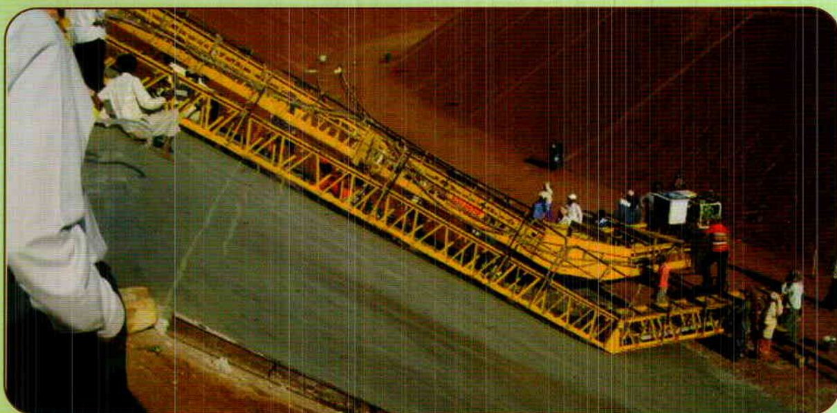
UPPER BHADRA PACKAGE - 2 : CONCRETE LINING UNDER PROGRESS