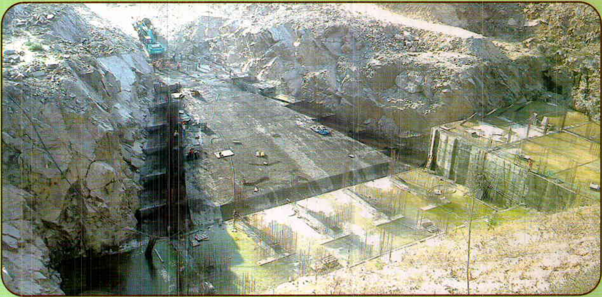
UPPER BHADRA PACKAGE - 1 : RAFT CONCRETING OF FOREBAY & PUMP HOUSE - 1