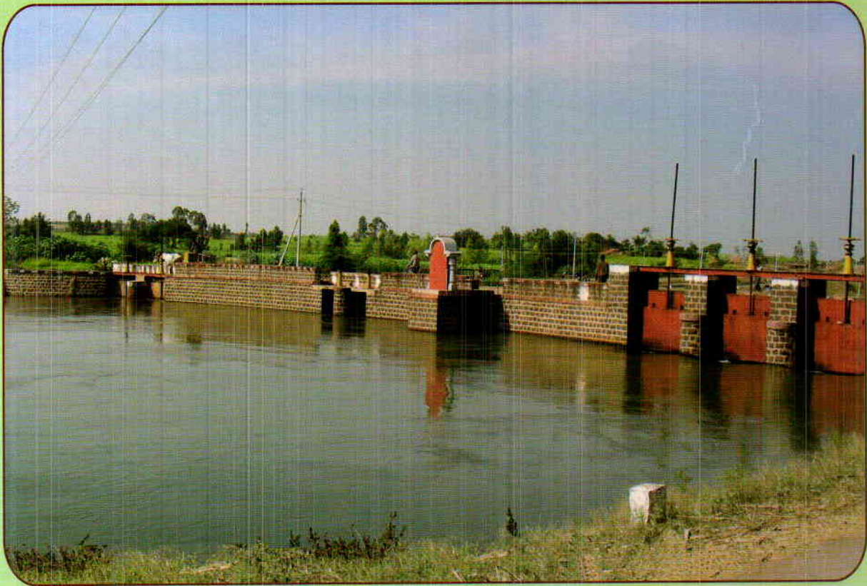
HEAD WORK OF CROSS REGULATOR NORTH BRANCH CANAL & ESCAPE @ KM 49+610 OF GLBC UNDER GHATAPRABHA PROJECT