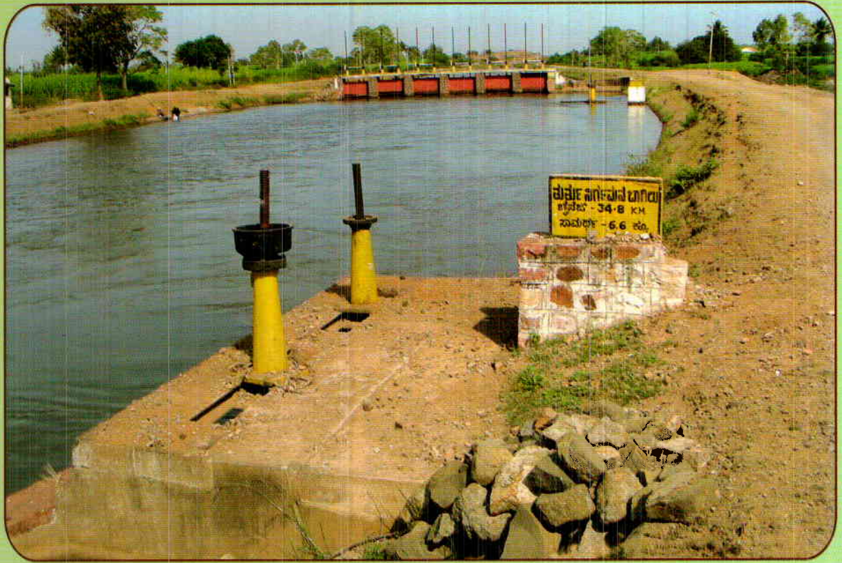
ESCAPE @ CH 34+900 OF GLBC UNDER GHATAPRABHA PROJECT