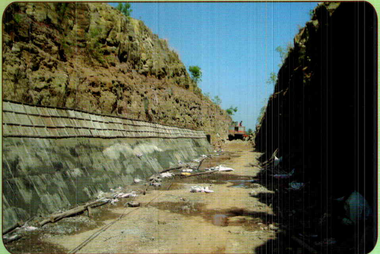
CC LINING @ CH 73+500 OF MAIN CANAL UNDER GHATAPRABHA PROJECT