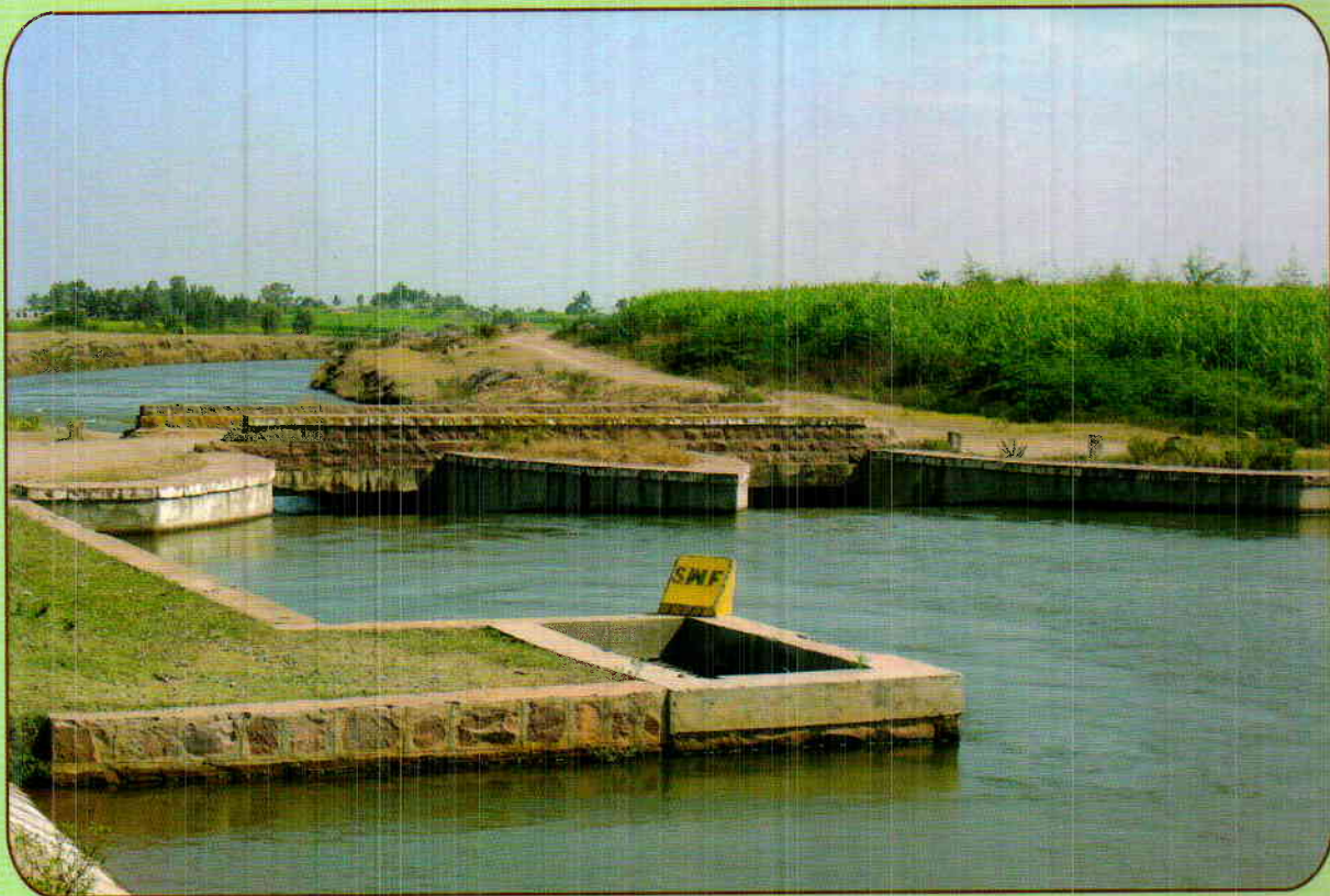
STANDING WAVE FIUME @ KM 50+800 OF GLBC UNDER GHATAPRABHA PROJECT