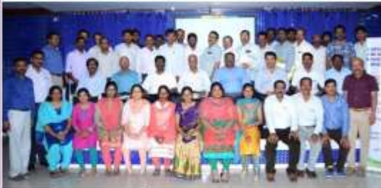
ಕಾರ್ಯಾಗಾರದಲ್ಲಿ ಭಾಗವಹಿಸಿದ ಪ್ರತಿನಿಧಿಗಳು

ಗೊಂದಿ ಸಾಲಿನ ಅಧ್ಯಕ್ಷರೇಣ ಕಾರ್ಯಾಗಾರಗಳು ಆರಂಭವಾಗಿರುವ ಹಿನ್ನೆಲೆಯಲ್ಲಿ ಒಂದು ದಿನದ ನಿರ್ಮಾಣ ನಿರ್ವಹಣೆ ಮತ್ತು ಗುಣಮಟ್ಟ ನಿಯಂತ್ರಣ ತರಬೇತಿ ಕಾರ್ಯಾಗಾರವನ್ನು ಯೋಜನಾ ಸೇವಾ ಸಂಸ್ಥೆಯಿಂದ (ಪಿ.ಎಸ್.ಸಿ.) ಆಯೋಜಿಸಲಾಗಿತ್ತು.