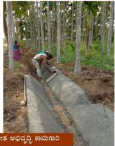
ಕಾಗೆಕೊಡಮಗ್ಗಿ ಅಚ್ಚುಕಟ್ಟು ಪ್ರದೇಶ ಅಭಿವೃದ್ಧಿ ಕಾಮಗಾರಿ