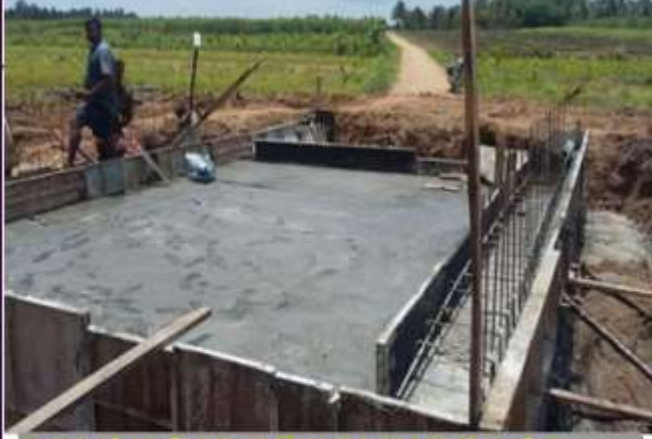
ಎಡದಂಡೆ ಸಾಲೆಯಲ್ಲಿ ಪ್ರಗತಿಯಲ್ಲಿರುವ ಕೆಲವು ಕೆಲಸಗಳು

ಈ ಯೋಜನೆಯು ಆಯ್ದು ನದಿ ಜಲಾನಯನ ಪ್ರದೇಶಗಳಲ್ಲಿ ನೀರಾವರಿ ವ್ಯವಸ್ಥೆಯನ್ನು ಉತ್ತಮ ಪಡಿಸುವ ಮೂಲಕ ಬೇಡಿಕೆಗನುಗುಣವಾಗಿ ನೀರಿನ ಲಭ್ಯತೆಯನ್ನು ಹೆಚ್ಚಿಸುವ ಉದ್ದೇಶ ಹೊಂದಿದೆ. ಅಲ್ಲದೆ ಪರಿಣಾಮಕಾರಿ ನೀರಿನ ಬಳಕೆಯನ್ನು ಪಾರಿಗೋಳಿಸುವ ಮೂಲಕ ಉದ್ಯೋಗ ಅವಕಾಶಗಳನ್ನು ಸೃಷ್ಟಿಸಿ, ಗ್ರಾಮೀಣ ಜನರ, ಆದರಲಿ ದೂರ ಮುಖ್ಯವಾಗಿ ಮಹಿಳೆಯರ ಆದಾಯ ವೃದ್ಧಿಸಲು ಬೆಂಬಲ ನೀಡಲಿದೆ.