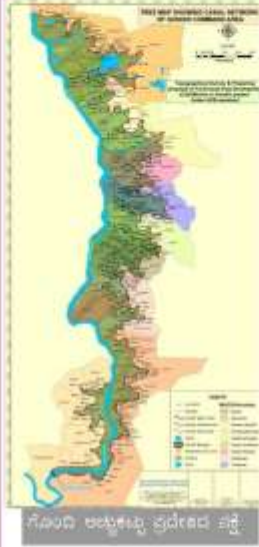
ಗೊಂದಿ ಅಭ್ಯುಕ್ತ ಪ್ರದೇಶದ ನಕ್ಷೆ