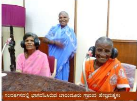
ಸಂವರ್ತನದಲ್ಲಿ ಭಾಗವಹಿಸಿರುವ ಚಾರಂದೂರು ಗ್ರಾಮದ ಹೆಣ್ಣುಮಕ್ಕಳು

13 ವಾರಗಳ ಕಾಲ ಪ್ರಸಾರವಾಗುವ ಸರಣಿಯಲ್ಲಿ ಗೊಂದಿ ಅಣೆಕಟ್ಟಿಯ ಇತಿಹಾಸ, ನಿರ್ಮಾಣ, ಸಮಸ್ಯೆಗಳು, ಯೋಜನೆಯ ಪರಿಚಯ, ಹಮ್ಮಿಕೊಂಡಿರುವ ವಿವಿಧ ಕಾರ್ಯಕ್ರಮಗಳು, ಭಾಗೀದಾರರ ಪರಿಚಯ, ಕೃಷಿ ಚಟುವಟಿಕೆಗಳು, ಮಿತ ನೀರಿನ ಬಳಕೆ ಮೂಲಕ ಭತ್ತದ ಬೇಸಾಯ ಮಾಡುವ ವಿಧಾನ, ಲಿಂಗತ್ತ ಮತ್ತು ಸಾಮಾಜಿಕ ಸಂಘಟನೆ ಮುಂತಾದ ಹಲವು ವಿಷಯಗಳನ್ನು ಸರಣಿಯಲ್ಲಿ ಅಳವಡಿಸಲಾಗಿದೆ. ಪ್ರತಿ ಸರಣಿಯು ಚೊತೆಗೆ ವಿಷಯಕ್ಕೆ ಪೂರಕವಾದ ಇಂಪಾದ ಹಾಡುಗಳೂ ಇರುತ್ತವೆ.