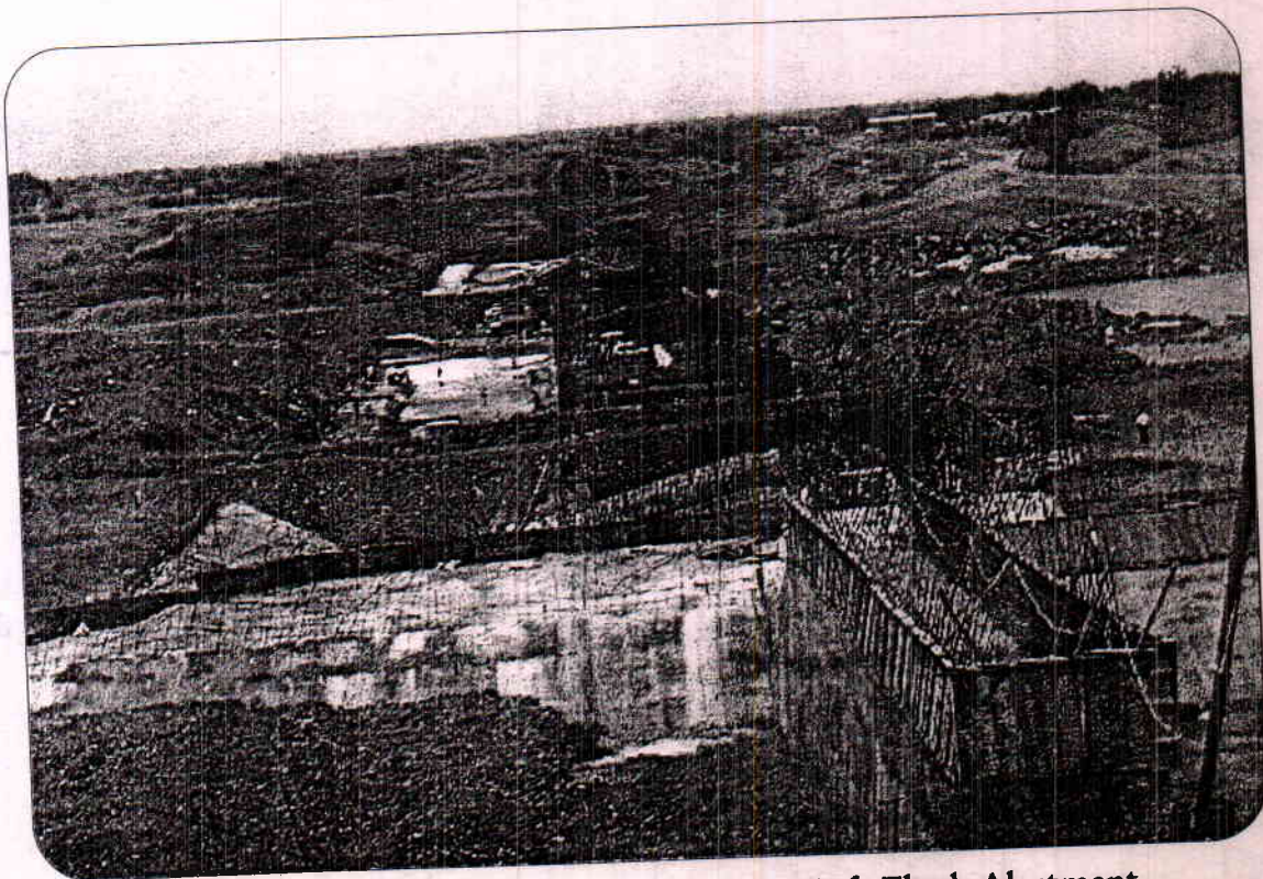
Construction of Bhima Lift Barrage from Left Flank Abutment near Sonna, Gulbarga District.